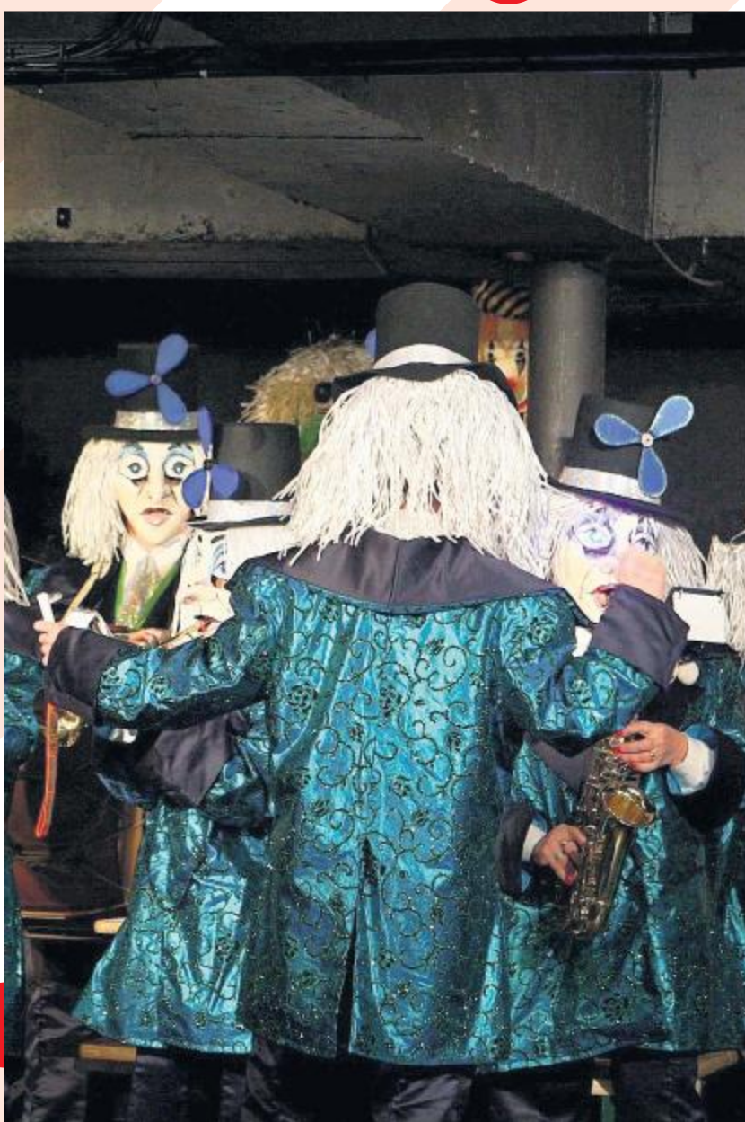
LAUT UND HEFTIG «D' Ventilatore» schränzen, dass die Wände beben.

Aufführungen für Kinder: Bis zum 7. Februar, jeweils Samstag und Sonntag, 14.30 Uhr. Für Erwachsene: 29.1., 30.1., 5.2., 6.2., 20 Uhr. Vorverkauf: Tel. 061 331 68 56, www.theater-arlecchino.ch